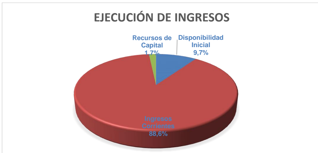
GRAFICO No.1 COMPOSICION DEL INGRESO EMPRESA DE ASEO DE PEREIRA S.A.S E.S.P VIGENCIA 2024